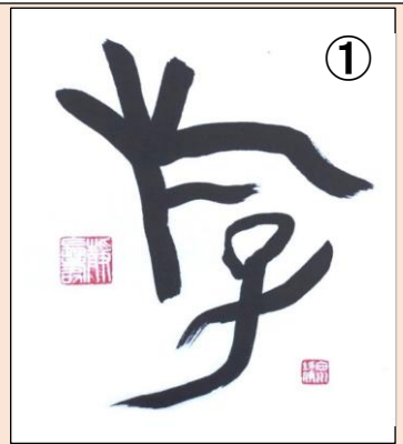
▲白川静博士が書いた漢字