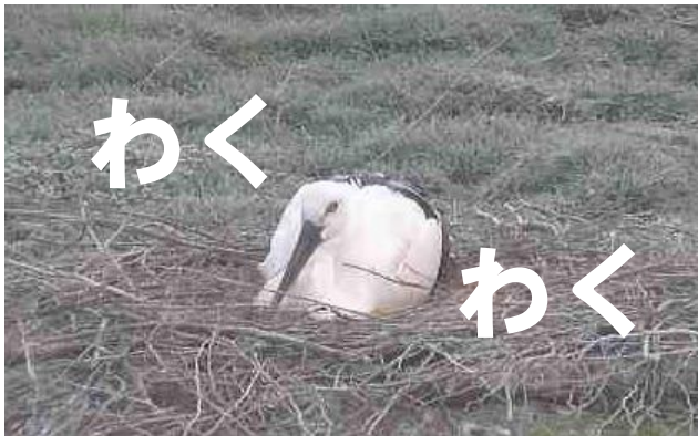
ふっくんを立たせようとしています。