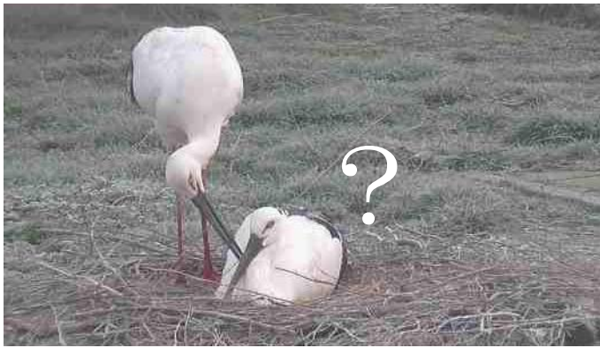
ふっくんが立ったら、すかさず巣の中をチェックします。まるで何か隠し事を暴こうとしているかのよう…