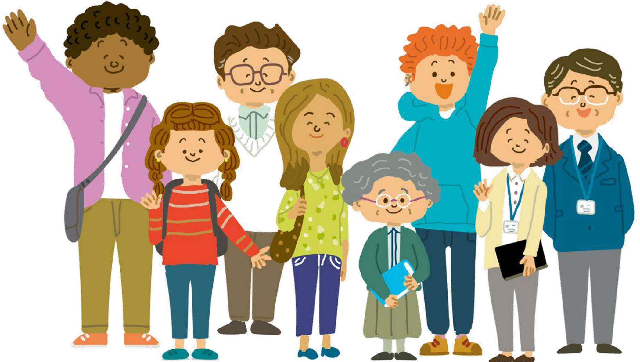
イラスト提供：札幌市教育委員会

やかんちゅうがく さまざま りゆう ぎむきょういく しゅうりょう ひと 夜間中学では、様々な理由により義務教育を修了できなかった人や、 ふとう こう とう がっこう かよ ひと 不登校等のためにほとんど学校に通えなかった人、 ほんごく ぎむきょういく しゅうりょう がいこく せき ひと まな また本国で義務教育を修了していない外国籍の人などが学んでいます。