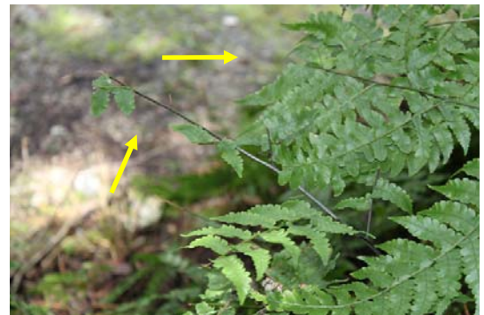
図 1 シカによると思われる食痕（シマシロヤマシダ）

ナチシダは少数個体の集団を含めると相当数の自生地が確認された。これはナチシダには有毒なセスキルテルペンが含まれシカが忌避していると考えられること、また、ナチシダは林道沿いや伐採跡地のような明るい環境を好み、シカ食害により下層植生の繁茂が抑えられたことで個体数が増加傾向にあることによると考えられる。一方、シマシロヤマシダについては、シカによると思われる食痕がすべての集団で確認された（図 1）。岩上に多いヌカイタチシダモドキやモミジチャルメルソウには目立った食害は確認されなかった。林床に生育するホオノカワシダは 1 個体も確認されなかったことから、シカ食害によりすでに一ツ谷国有林から絶滅した可能性がある。