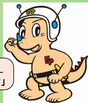
福井県警察 マスコットキャラクター 「リュウピー君」