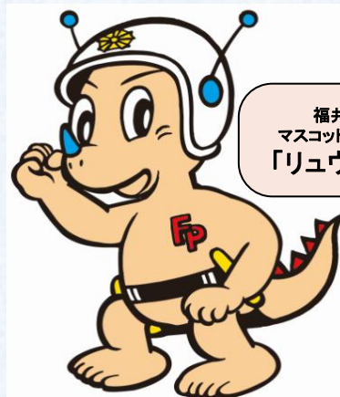
福井県警察 マスコットキャラクター 「リュウピー君」

応募期間 2017年10月4日(水)～12月15日(金)まで ※当日消印まで有効です。