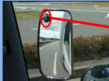
じどうにりんしゃ しかく サイドミラーでは自動二輪車 を確認できない。