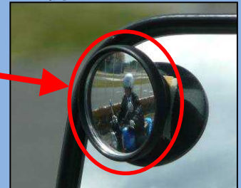
ほじょ しかく じどうにりんしゃ しかく 補助ミラーでは死角にいる 自動二輪車を確認できる。