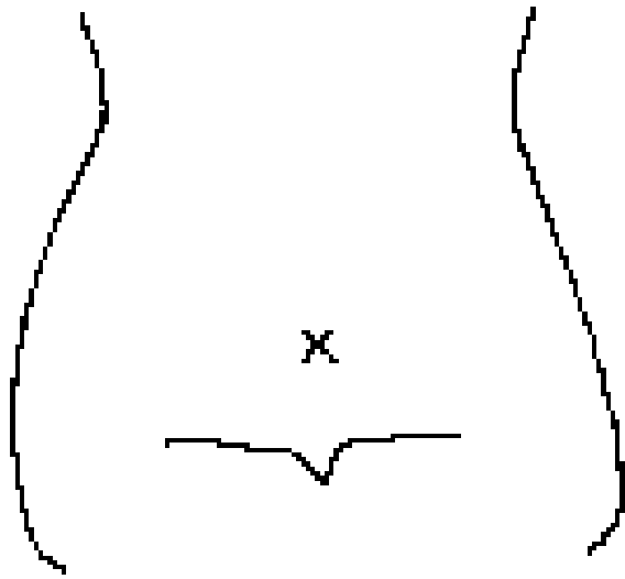
(ストマおよびびらんの部位等を図示)