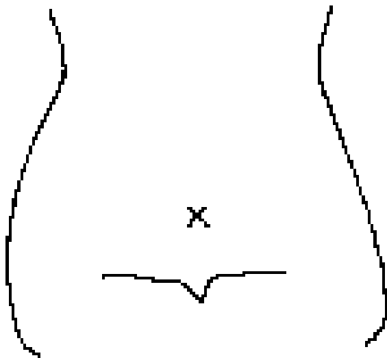
(ストマおよびびらんの部位等を図示)