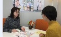
縁結びさん同士の交流会や相談会等を開催