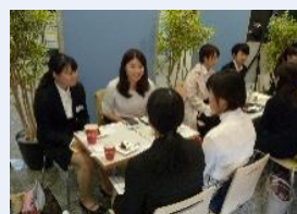
就活女子応援員等が学生に福井の企業を紹介