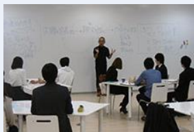
大学連携センターで地域志向科目を開講