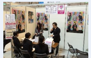
合同企業説明会において女性活躍推進企業をPR