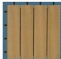
木粉・樹脂ペレットを使ったウッドデッキ材