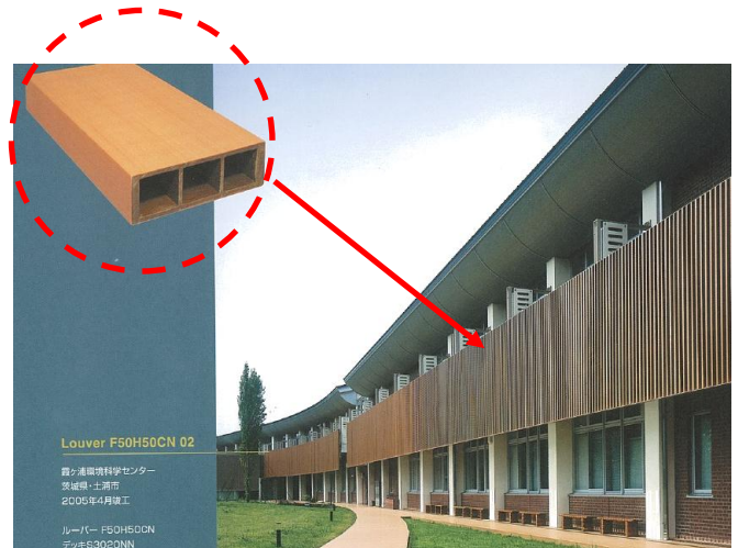
建築用資材の使い方の一例

この施設により、あわら市と坂井市から生産される間伐材のおよそ3割に当たる、約1万5千本の間伐材が使われます。