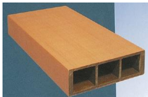
木粉・樹脂ペレットを使った建築用資材