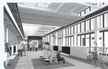
福井駅のホーム

今年4月、県内4駅舎(芦原温泉、福井、南越(仮称)、敦賀)の外観や内装の詳細なデザインが決定しました。天井や柱、照明などに県産スギ材や笏谷石、越前和紙が使われるなど、地域の特色を反映したデザインとなっています。また、先月31日には敦賀・新大阪間の大まかな駅の位置とルートが公表されました。今後4年程度をかけて、環境への影響を事前に予測し評価する環境アセスメントを行い、駅の位置やルートを絞り込んでいくことになります。