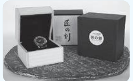
昨年度認定事業(越前焼の腕時計開発)

新商品開発やイベント開催などの新たなプロジェクトにチャレンジする方をクラウドファンディング型ふるさと納税により応援します。昨年度は認定した6事業全てが目標金額を達成。今年度から「地域おこし協力隊特別枠」を創設し、地域おこし協力隊経験者が「微任」(週末居住などの短期滞在)して取り組む地域活動にも対象を拡大しました。