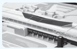
展示する駅舎模型(敦賀駅)