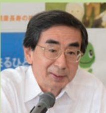
福井県知事 西川 一誠

福井県は「子どもの幸福度」調査において、「健康」「地域・家族」「安心・安全」「教育」「豊かさ」5分野の総合評価で日本一に輝きました。「第三次福井県元気な子ども・子育て応援計画」の2年目を迎える今年度は、この評価を活かし、全国初の「ふくいの子宝応援給付金」をはじめ、全国のモデルとなる子育て政策を次々と実現しています。