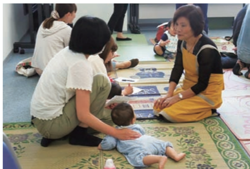
子育てマイスターとの育児相談

8月には、児童扶養手当の第2子加算額を五千円から一万円へ、第3子以降加算額を、三千円から六千円へそれ