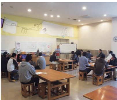
父親向け育児分担ワークショップ

さらに、企業に奨励金を支給して男性の育児休暇の定着を図るほか、父親の育児分担を進めるためのワークショップを開催しています。