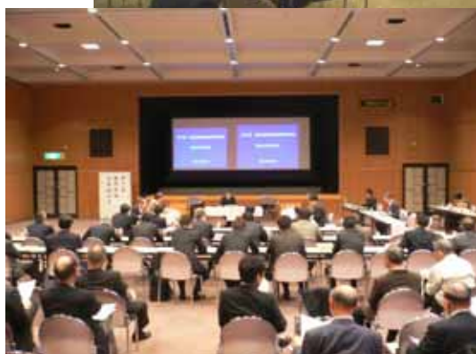
第 9 回流域検討会議の様子