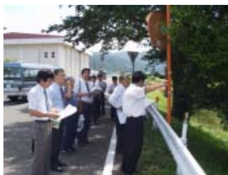
佐分利川現地視察の様子