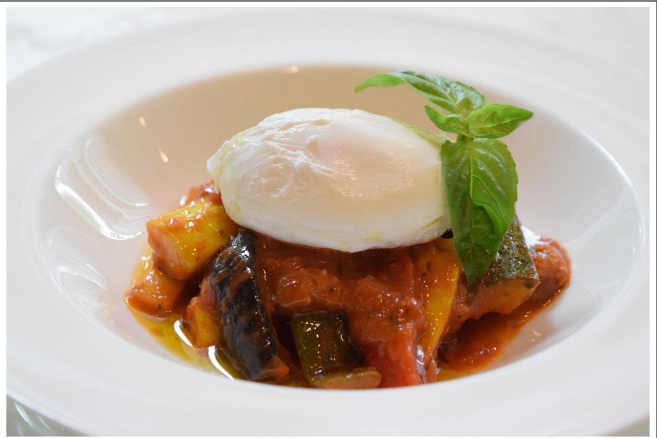
ポーチドエッグの地場産のラタトゥイユ 4人前 分量